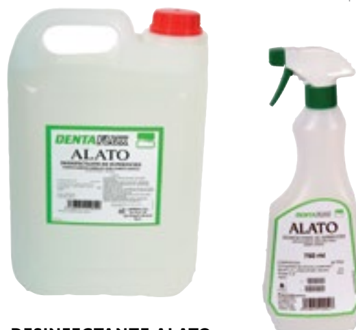
Desinfección de superficies