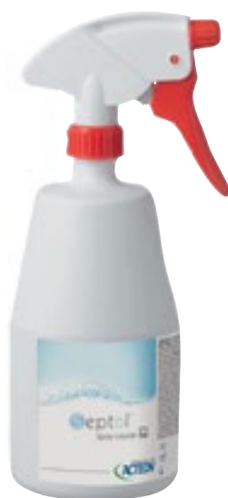
Desinfección de superficies