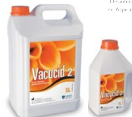
Desinfección de Aspiración

Limpieza y desinfección de los sistema de evacuación y escupidera.