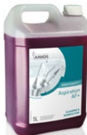
Desinfección de Aspiración