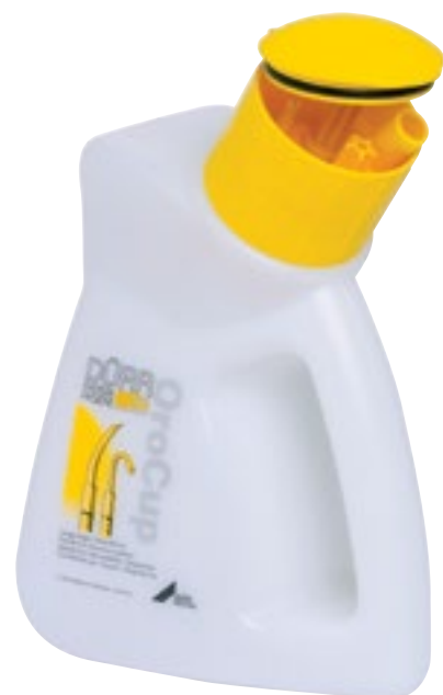
Desinfección de Aspiración