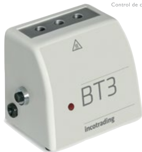
Control de carga