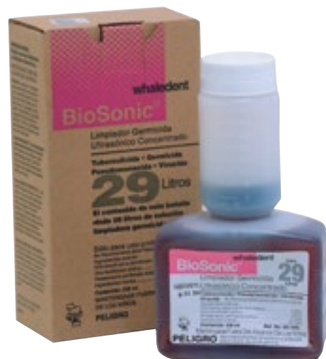
Desinfección de Instrumentos