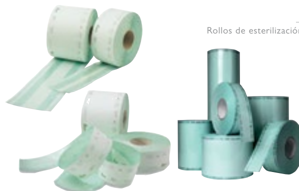
Rollos de esterilización