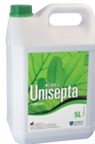
Desinfección de superficies

Solución desinfectante lista para usar a base de alcohol, para una desinfección en 30 segundos de superficies de dispositivos médicos. Ideal para usar entre dos pacientes. Amplio espectro de eficacia: Bactericida: EN 1040, EN 1276, EN 13727, EN 14561; SARM; Tuberculosis: EN 14348; Levuricida: EN 1275, EN 13624; Virucida: H1N1, VIH-1, PRV (virus modelo VHB), BVDV (virus modelo VHC, Herpesvirus, Rotavirus, Adenovirus y Coronavirus bovino (SARS). Sin aldehídos. Fresco perfume a limón.