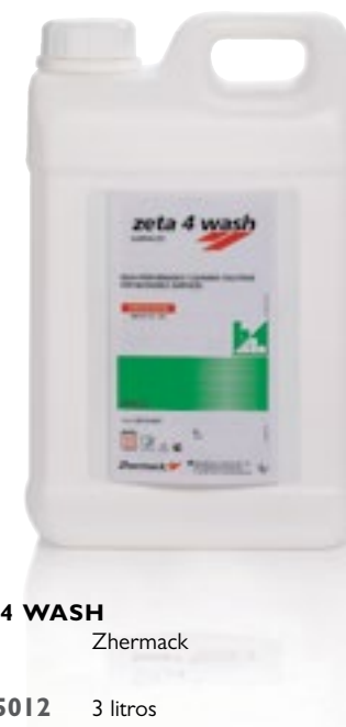
Desinfección de superficies

Desinfectante de superficies con base de alcohol, sin aldehídos. Listo para su uso. Amplio espectro testado según norma UNE EN 13697. Registrado en el Ministerio de Sanidad. No ataca a tapicerías de sillones. Eficaz y cómodo. Envase de 750ml con pulverizador.