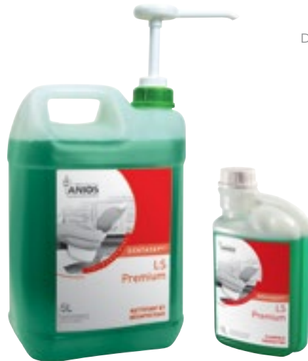
Desinfección de superficies