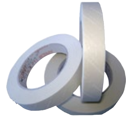
Rollos de esterilización