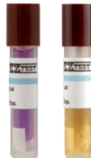
Control de carga

Incubadora de 3 huecos para indicadores biológicos de vapor de agua. • Incubación simultánea • Con una cavidad para la activación del indicador • Termómetro digital integrado en la misma máquina • Perfecta distribución del calor que asegura una correcta incubación de los indicadores biológicos