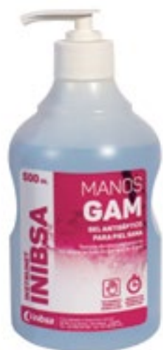
Limpieza de manos

Instrunet Inibsa Jabón Biocida, jabón antiséptico para piel sana con clorexidina al 4%. Amplio espectro de acción.