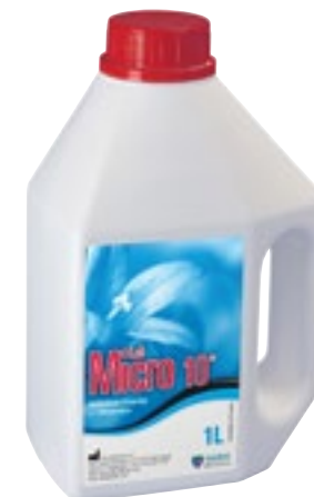
Desinfección de Instrumentos

Para la desinfección por inmersión, en frío, del material termosensible y material de cirugía dental. Combinado con ultrasonidos permite la limpieza y desinfección del material. Sin aldeídos. Envase de 5 litros para diluir al 2%.