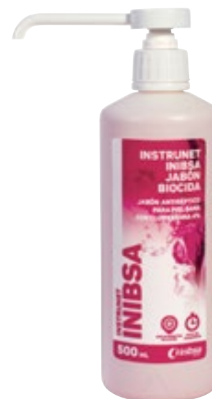
Limpieza de manos