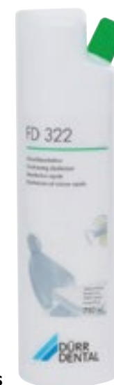
Desinfección de superficies

Marca: Dürr Ref. 02025 Hygowipe Plus Dispensa-Toallas 646,00 € Ref. 02026 Hygowipe Plus Rollo (6 x 110 m.) 61,10 € Ref. 02027 FD-322 para Hygowipe Plus. 750 ml. 16,40 €