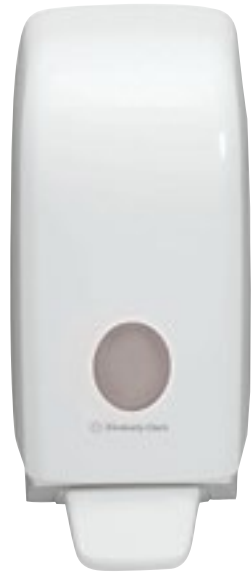
Limpieza de manos