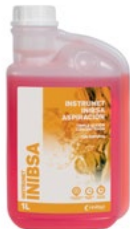
Desinfección de Aspiración