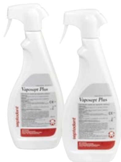
Desinfección de superficies