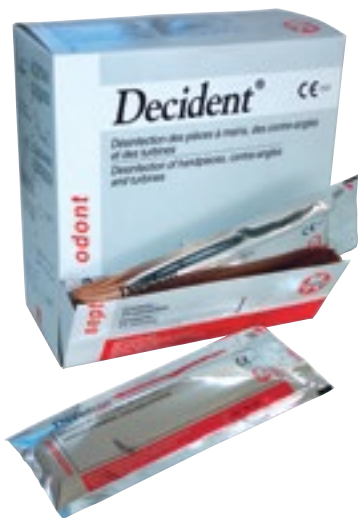
Desinfección de Instrumentos