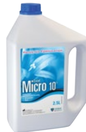
Desinfección de Instrumentos

Solución desinfectante detergente tri-enzimática sin aldehídos activa en tan solo 5 minutos para el tratamiento de todo tipo de instrumentos dentales y quirúrgicos antes de su esterilización. Amplio espectro de eficacia (Bactericida: EN 1040, EN 13727, EN 14561; Tuberculocida (en 30mn) EN 14348, EN 14563; Levuricida: EN 1275, EN 13624, EN 14562; Virucida: EN 14476 VIH-1, PRV* (VHB), BVDV* (VHC), Herpesvirus y Vaccinia virus). Alto poder detergente sobre residuos orgánicos tal como proteínas, grasas y azúcares. Ph. neutro: compatible con todos tipos de instrumentos incluso las fresas. Dilución muy económica al 1% (1L de concentrado = 100L de solución lista para el empleo. Se utiliza tanto en cubeta de desinfección como en cuba de ultrasonidos. Contiene inhibidores de corrosión que protegen los instrumentos contra la oxidación. Suave perfume a Limón.