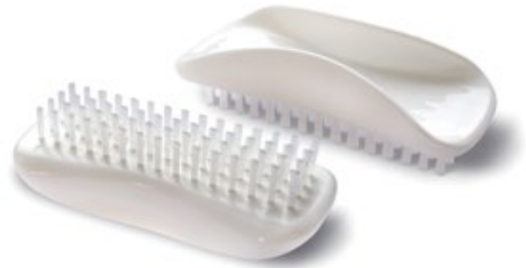
Limpieza de manos

Este producto es compatible con nuestras referencia de Proclínica 7664 y 93578 Dispensador de jabón líquido para uso diario ultra y antibacteriano.