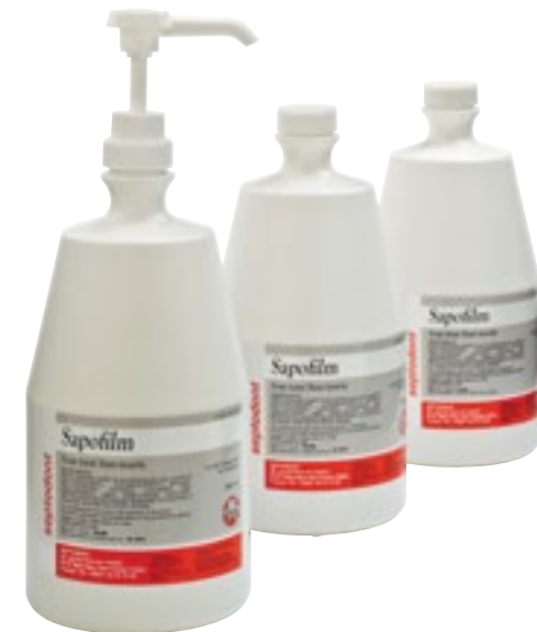
Limpieza de manos

Jabón destinado a aquellos que tienen que lavar sus manos con frecuencia, como el personal médico de los hospitales, dentistas, etc. Muy suave, cremoso y espumoso; dermatológicamente probado. El jabón líquido extrasuave no perfumado Tork Premium carece de aromas y colores artificiales.