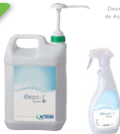
Desinfección de Aspiración