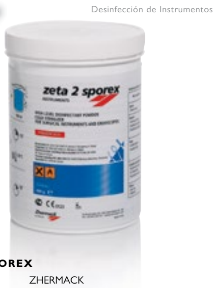
Desinfección de Instrumentos