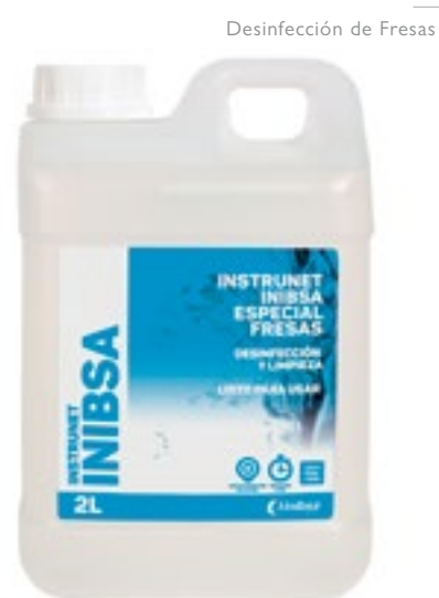
Desinfección de Fresas