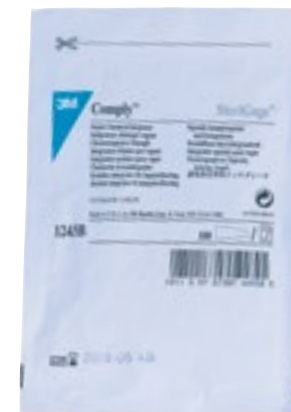
Control del paquete

Destinados a ofrecer información al usuario de como se ha desarrollado el proceso de esterilización, de acuerdo con su clasificación. Desde la aparición de la norma UNE-EN ISO 1140-1 los indicadores químicos para esterilización se encuadran, de acuerdo con su tolerancia, en diferentes Clases siendo las 4 y 5 las más exigentes para con los requisitos de funcionamiento y márgenes de variación respecto de lo declarado.