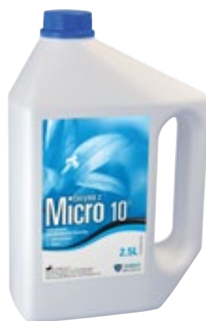
Desinfección de Instrumentos