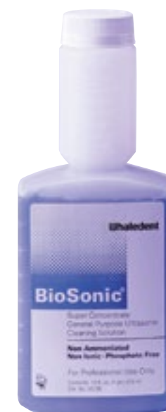
Desinfección de Instrumentos

Ref. 4137 Para 29 l. de disolución. 41,00 €