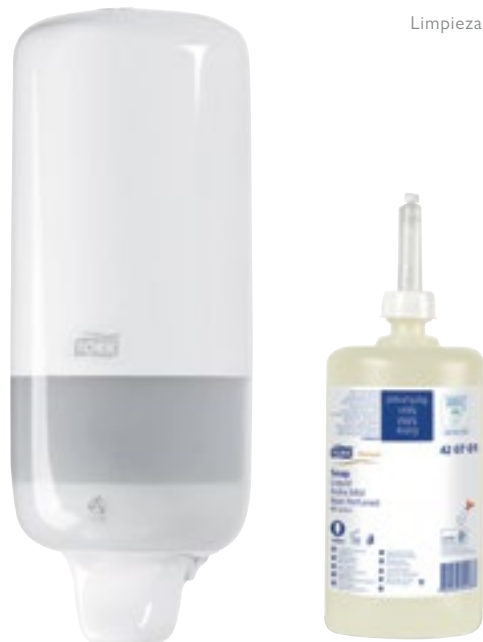
Limpieza de manos