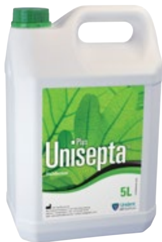
Desinfección de superficies