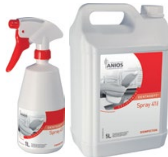
Desinfección de superficies

Detergente desinfectante sin alcohol. Activo en 5 minutos. Sin aldehídos. Lista para usar, para la desinfección y limpieza de todos tipos de superficies de dispositivos médicos. Conviene tanto para las zonas sensibles al alcohol que para los pequeños instrumentos. Amplio espectro de eficacia: Bactericida EN 1040, EN 13727, EN 13697 (SARM incluido); Levuricida: EN 1275, 13624, EN 13697; Virucida: EN 14476: VIH-I, PRV (virus modelo VHB), BVDV (virus modelo VHC), Herpesvirus, Vaccinia virus, Polyomavirus SV40. Activo en 5min. Suave perfume a naranja.