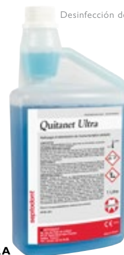
Desinfección de Instrumentos

Desinfectante universal para instrumentos. Limpieza en frío. Sin adheidos ni fenoles.