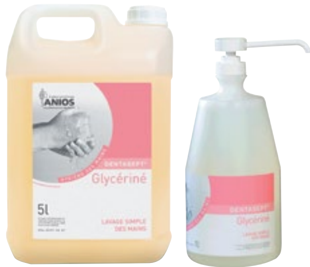
Limpieza de manos