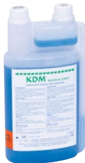
Desinfección de Instrumentos

Desinfectante y esterilizador en polvo con un campo de acción completo. ZETA 2 SPOREX es apto para la limpieza, la desinfección de alto nivel y la esterilización química en frío de los instrumentos odontológicos (bisturís, alicates, pinzas, fresas, espejos, sondas, etc.) y, en particular, de todos los dispositivos que no pueden esterilizarse en autoclave (endoscopios, fibras ópticas, instrumentos de goma, plástico, etc.). La solución preparada permanece estable al menos 24 horas, aunque es oportuno renovarla al final del día del trabajo.