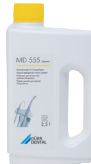
Desinfección de Aspiración

Detergente desinfectante no espumoso para la limpieza y desinfección de todos los sistemas de aspiración. Actividad bactericida al 2% en 5mn (EN 1040, EN 13727, EN 14561), levaduricida al 2% en 5mn (EN 1275, EN 13624, EN 14562), activo según EN 14476+A1 al 2% en 5mn, sobre BVDV (virus modelo HCV), Herpes virus, virus Vaccinia. Económico: diluir al 2%, es decir, 20ml por litro de agua. Rápido: activo en tan solo 5 minutos. Fórmula sin aldehídos.