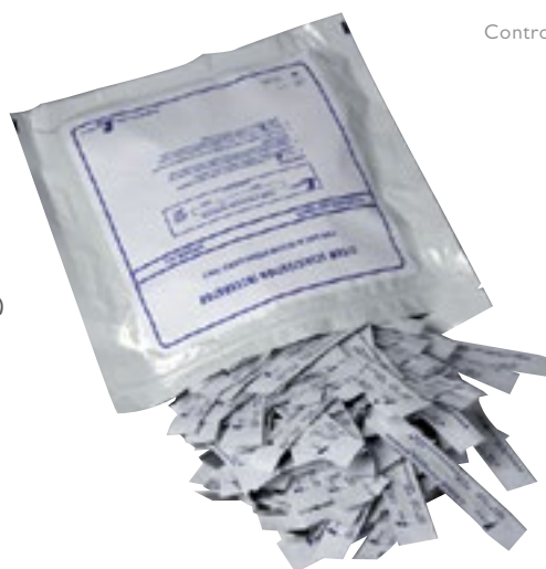
Control del paquete