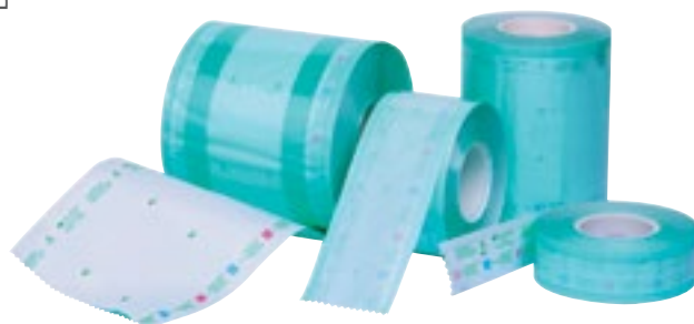
Rollos de esterilización