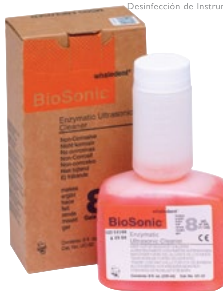
Desinfección de Instrumentos

Ref. 4114 Para 29 l. de disolución. 46,00 €