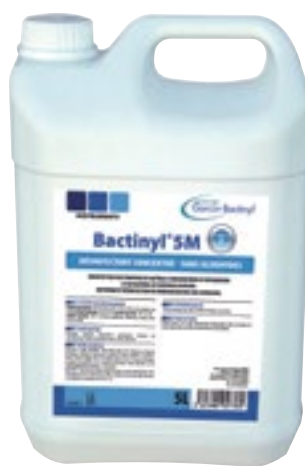
Desinfección de Instrumentos