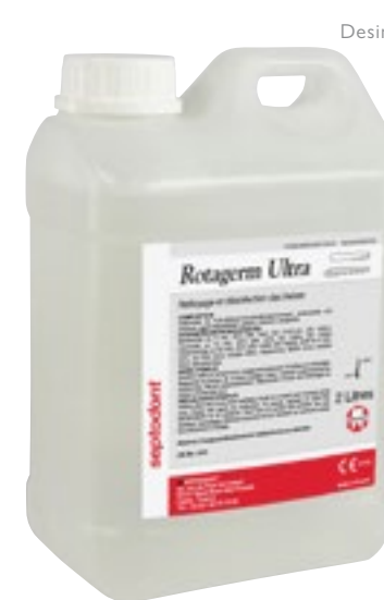
Desinfección de Fresas

Instrunet Inibsa Especial Fresas es una solución desinfectante y detergente lista para usar para el tratamiento de fresas e instrumentos de endodoncia antes de su esterilización. Ideal para uso en cubeta de ultrasonidos. Eficaz en 5 minutos.