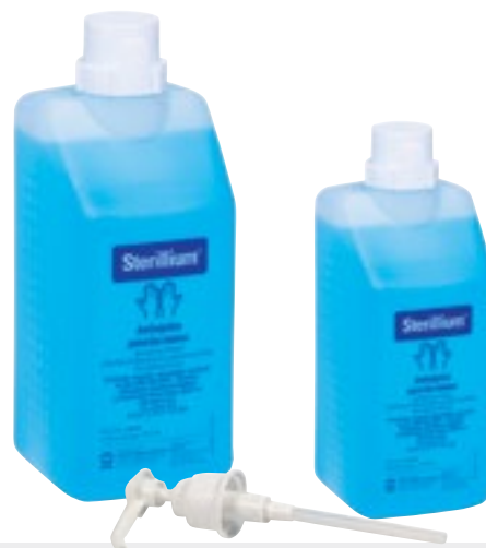
Limpieza de manos

Es bactericida, fungicida y virucida en 30 segundos.