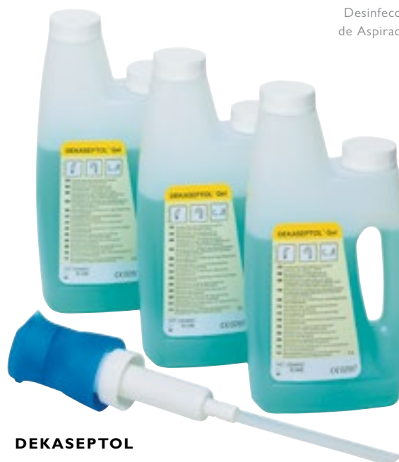
Desinfección de Aspiración

Instrunet Inibsa Especial Aspiración es un desinfectante de triple acción: desinfectante, desincrustador y limpiador concentrado en 15 minutos. Indicado para todo tipo de sistemas de aspiración en entornos dentales. No produce espuma. Es bactericida, levuricida, tuberculicida y virucida