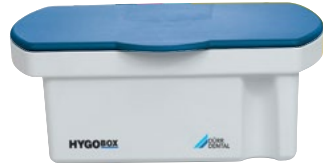
Desinfección de Instrumentos