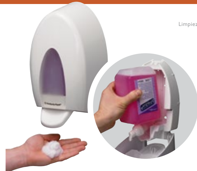
Limpieza de manos

Jabón suave con glicerina para el lavado frecuente de las manos. Recomendado para las pieles sensibles y los usos repetidos. Formula bacteriostática y fungistática.