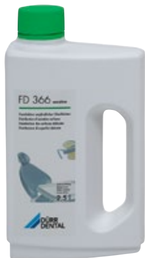
Desinfección de superficies