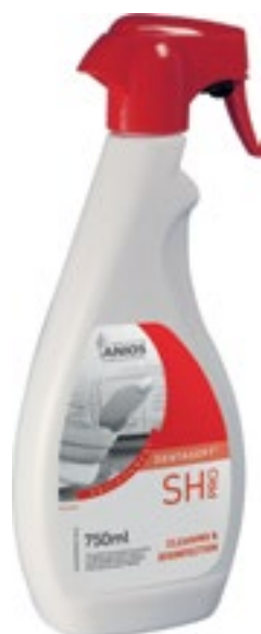
Desinfección de superficies

Spray desinfectante listo para usar en base de alcohol. No deja huellas y mantiene brillantes las superficies. Actividad bactericida en 5min (EN 1040, EN 13727, EN 13697) SARM incluido (13727), levaduricida en 5min (EN 1275, EN 13624, EN 13697), fungicida en 15min (EN 1275, EN 13624, EN 13697) y activo según EN 14476+A1 en 1min, sobre PRV (virus modelo VHB), BVDV (virus modelo HCV), Herpes virus, virus Vaccinia. Aroma suave y agradable. Fórmula sin aldehídos.