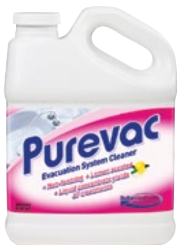
Desinfección de Aspiración