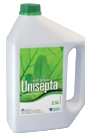
Desinfección de superficies

Spray detergente desinfectante listo para usar sin alcohol y sin perfume, compatible con todas las superficies. Recomendado para las superficies a base de polímero tal como sillón dental, escupideras... Uso agradable y seguro: en pistola para espuma que evita la formación de aerosol y que permite visualizar la zona tratada. Actividad bactericida en 2mn (EN 1040, EN 13727, EN 13697) SARM incluido (EN 13727, EN 13697), levaduricida en 5mn (EN 1275, EN 13624, EN 13697) y activo según EN 14476+A1 en 1mn, sobre PRV (virus modelo VHB), BVDV (virus modelo HCV), Herpes virus, virus Vaccinia, Rotavirus y Polyomavirus SV 40 en 5mn. Fórmula sin aldehídos.