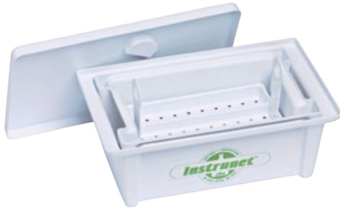
Desinfección de Instrumentos