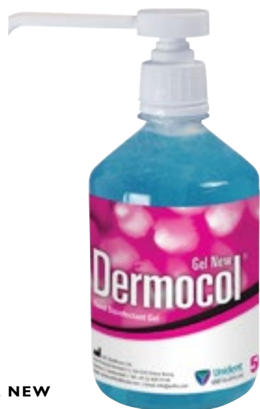
Limpieza de manos