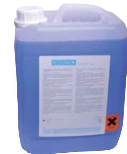
Desinfección de Aspiración

SEPTOL Spray es el resultado de la asociación de tres moléculas desinfectantes, que tienen diferentes mecanismos de acción antimicrobiana. Por otro lado, contiene un alto porcentaje de alcohol, lo que asegura un secado rápido y sin rastro. No contiene aldehídos y no deja rastro de película de grasa después de la pulverización. Líquido transparente incoloro, ligeramente perfumado. SEPTOL Spray cumple con los siguientes estándares actuales: Bactericida: NF EN 13727 - NF EN 1040 - NF EN 1276. Fungicida: EN 1650 (C. albicans) - NF EN 1275 (C. albicans). Actúa sobre: Rotavirus, HIV-1, BVDV (sustituto Hepatitis C), Hepatitis B, Virus gripe A [H1N1], Virus Herpes Humano tipo 1, K (Tuberculosis micobacteriana).