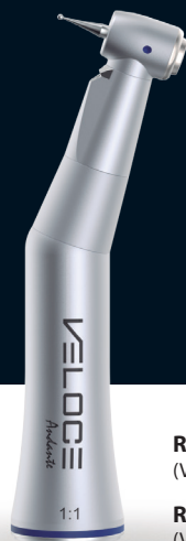
Ref 21982 con luz (VLE11L)