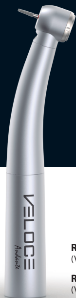
Ref 21979 con luz (VHE21KL)

Micromotor de aire, conexión, INTRAmatic®, refrigeración interna, Máx. 20.000 rpm, giro derecha-izquierda, anillo regulador spray, conexión Midwest, 4 orificios