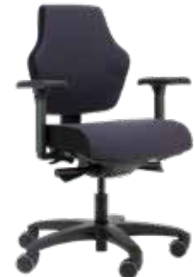
Score At Work Bicolor