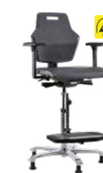
Score At Work 4408 ergonómica y completamente configurable