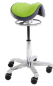
Amazone con mecanismo Balanceo