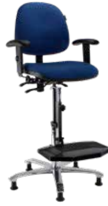
Ergo 2308 Flex