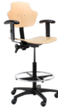
Spirit 1502 en madera de haya