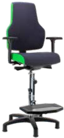
SCORE At Work Bicolor L