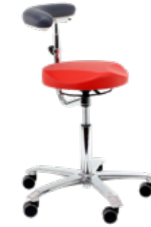
Medical 6360 con Soporte 360°