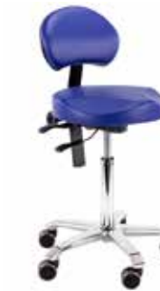
Medical 6311 con forma Ergo