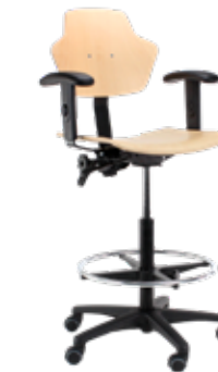
Spirit 1502 gran calidad con funcionalidades básicas

“Confort, ergonomía óptima y fácil para limpiar”