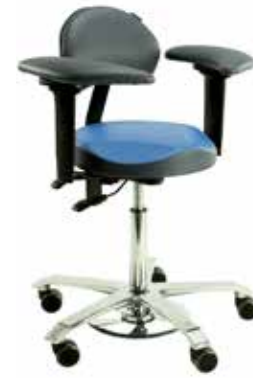
Ergo Support para usuarios que trabajan con microscopio