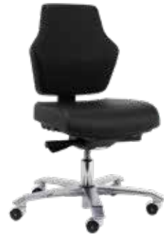
Score At Work Stamskin