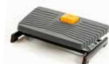
Reposapiés PRO 952