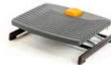
Reposapiés PRO 959