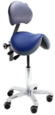
Jumper con soporte lumbar