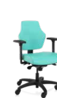
Score At Work Stamskin mayor confort