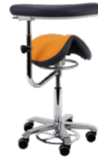
Silla de montar con Soporte 360°.