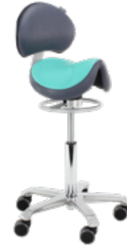
Amazone Balanceo con soporte lumbar