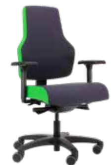
Score At Work Bicolor Tapizado bicolor de moda