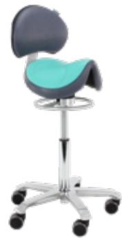
Amazone Balance lumbar support con soporte lumbar