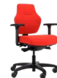
Score At Work Blend Tapizado lujoso y confortable