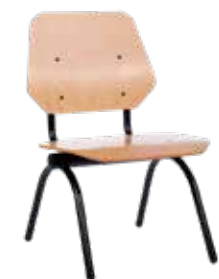
Silla sala de espera MaXX Line