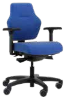
Score At Work Blend