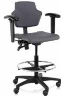
Spirit 1502 PU Pro (poliuretano)