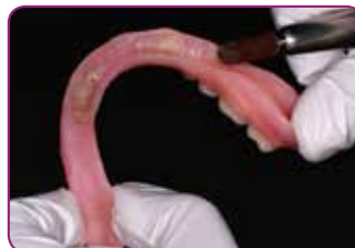
Prepare el área que va a rebasar y raspe la superficie.