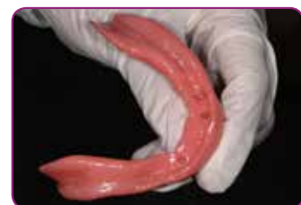
Prótesis removible rebasada.