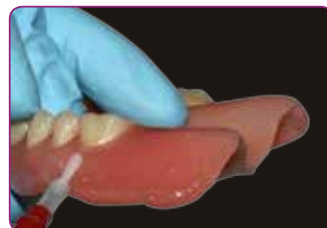
Los márgenes se pueden proteger mediante Reline II Finishing Material

El material permanece suave e inodoro y mantiene su elasticidad y estabilidad dimensional durante semanas o meses. ¿El resultado? Una solución duradera y conveniente para los pacientes con prótesis removibles.