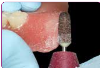
Capacidad de corte mejorada para un mejor acabado de los márgenes

Su capacidad de corte mejorada hace que el acabado definitivo de los márgenes sea incluso más fácil.