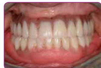
Asiente la prótesis removible en la boca y ajuste el músculo. No la mueva durante 5 minutos.