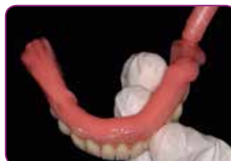
Aplique RELINE II (Extra) Soft de GC. Tiempo de trabajo de 2 minutos.