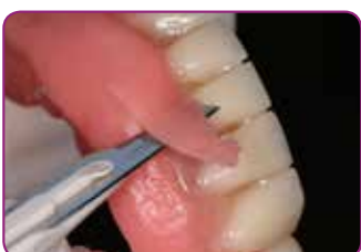
Retire el exceso mediante un bisturí o unas tijeras. Repasado con puntas para repasado GC Reline II Point for Trimming.