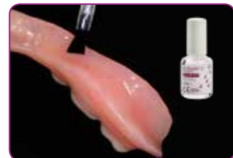
Aplique primer RELINE II de GC en el área que vaya a rebasar. Seque cuidadosamente con aire.