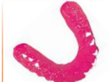
Férulas indicadoras Material: BRUX CHECKER®