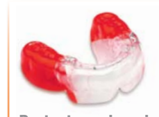
Protectores bucales deportivos Material: BIOPLAST® o BIOPLAST® XTREME (unicolor o multicolor)