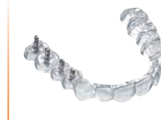
Férulas para implantes Material: DURAN®