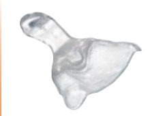
Cubetas individuales Material: IMPRELON® transparente u opaco