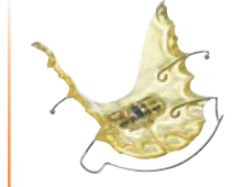
Férulas con tornillo de expansión / retenedoras Material: BIOCRYL® C