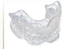
Posicionador Material: BIOPLAST® transparente