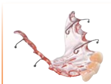
Placas provisionales Material: BIOCRYL® C (rosa-transparente)