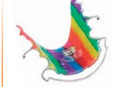
Férulas con tornillo de expansión / retenedoras Material: BIOCRYL® M (multicolor)