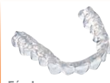
Férulas (también aparatos apnea) Material: DURAN®, IMPRELON® S pd o DURASOFT® pd