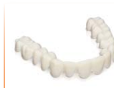
Provisorios y férulas de color dental Material: DURAN®+A2