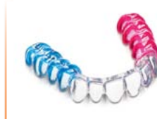
Férulas duras-blandas Material: DURASOFT® pd con DURASOFT® seal