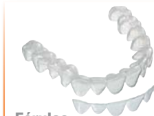
Férulas de blanqueamiento Material: COPYPLAST® o BIOPLAST® bleach