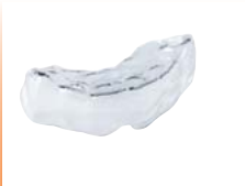
Retenedor invisible Material: COPYPLAST®