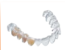
Férulas provisionales Material: DURAN®