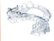
Aparato IST® Material: DURAN®