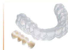
Provisionales Material: COPYPLAST®