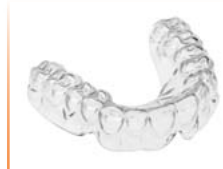
OSAMU-Retainer® Material: IMPRELON® S pd BIOPLAST®