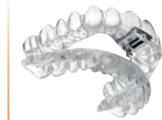
Férulas TAP® Material: DURASOFT® pd 2,5 mm