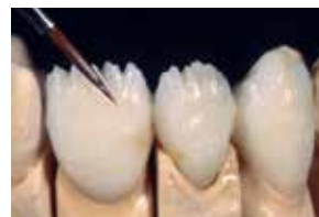
Utilice los Lustre Pastes