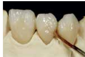
Aplicación de los colores de cuerpo