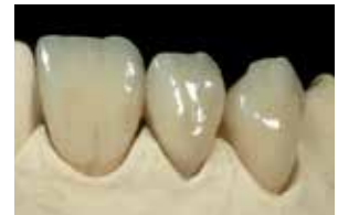
Restauración final, ofreciendo brillo y color

Con los Lustre Pastes NF, puede modificar fácilmente las coronas y los puentes cerámicos convencionales. Nunca había sido tan fácil cambiar el brillo, el color y el valor.