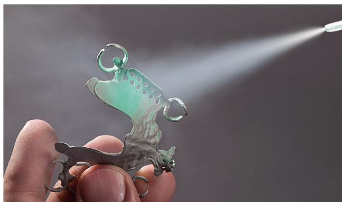
Dosificación óptima de la película micropulverizada