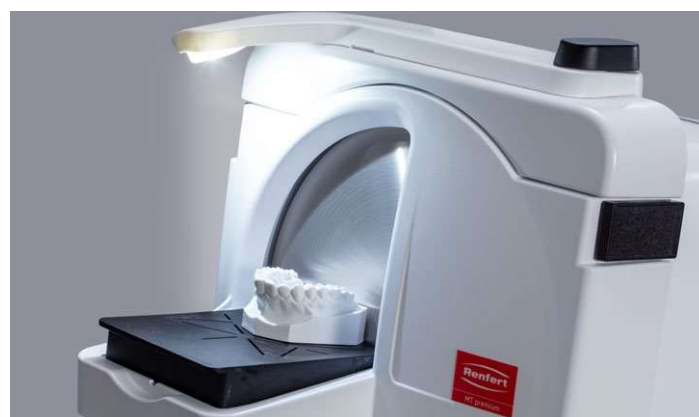
Iluminación óptima de la zona de trabajo