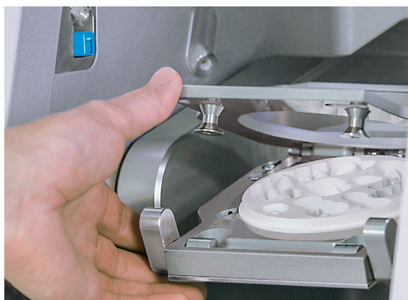
Sujeción con una sola mano gracias a la función DirectDiscTechnology