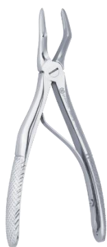
59676 - Fórceps Pediátricos N°5