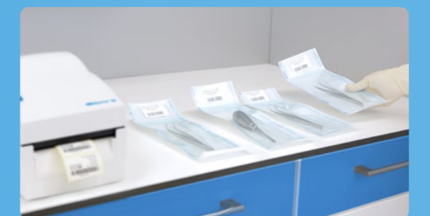
✓ Etiquetado con MELAprint 80