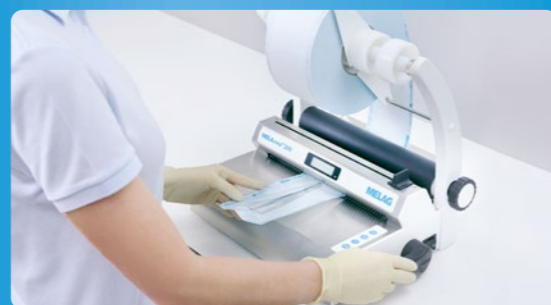
✓ Embolsado con MELAseal o MELAstora