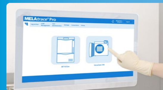
✓ Documentación y liberación con MELAtrace