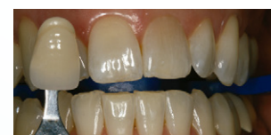
Después de Philips Zoom