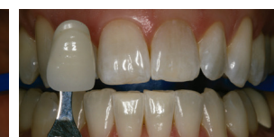
Mejora de ocho tonos

En un estudio, el sistema Philips Zoom Whitespeed, proporcionó 50% mejores resultados que un competidor, tanto inmediatamente después del procedimiento como después de 7 y de 30 días, utilizando una fórmula de 25% HP en comparación con la fórmula de un competidor de 40% HP.3